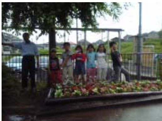
完成、楽しく記念撮影