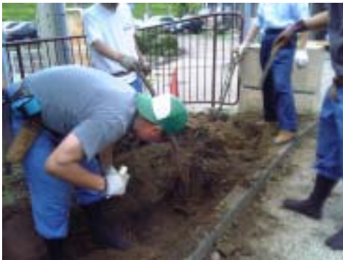
職員による地ごしらえ

花壇をつくるための土作りから花苗や種、球根の支援を実施します。限られた予算を有効に活用するため、また、花をめぐるだけでなく、育つ状況からも楽しむために、球根や種からの栽培も是非ご検討下さい。ひまわり、チューリップ、菜の花、コスモスなど種や球根から比較的簡単に育てられるものも多くあります( 10章)。