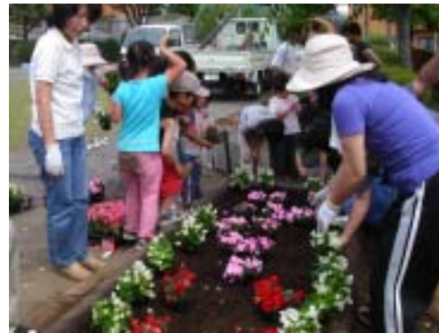
子どもたちも参加して花苗の植え付け