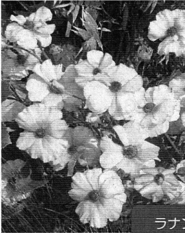
ラナンキュラス ラックス

季節のうつろいが早く、梅雨に入りじめじめしますね。梅雨明け後は体が暑さに慣れていないので、水分補給などをして体調管理に気をつけましょう。