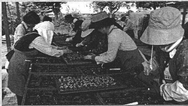
ポット上げの様子。 ボランティアの皆さんの力で配布ができます。

種まき後、気温の上げ下げが激しく、風の強い日が多く、苗が育つには厳しい環境下にありました。したがって、一部の苗の配布が後ろ倒しになる可能性があります。ご理解くださるよう、お願いいたします。