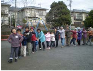
つながってジェンカ