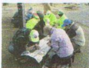
1月6日(金) 泥亀公園 樹名板と焼き芋イベント