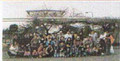
1月28日(土) 釜利谷坂本公園樹名板講習 と焼き芋イベント