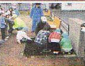
3月8日(木) 大川公園植樹イベント

小さなハナモモを大川公園に植え付けました。植えたのは釜利谷保育園児です。その後、園に戻りいろいろなゲームをして子どもたちと遊びました