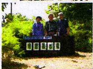
能見田野地久保公園